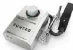
高解析喷码机系列