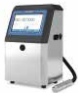
小字符喷码机系列