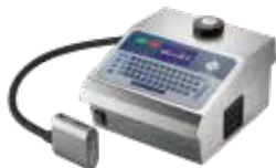
DOD大字符喷码机系列