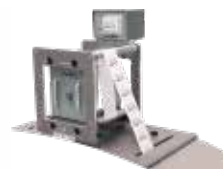
TTO热转印打印机系列